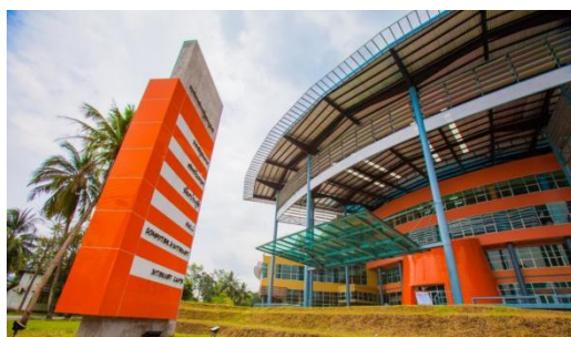
อาคารหอสมุดและศูนย์สารสนเทศเฉลิมพระเกียรติ