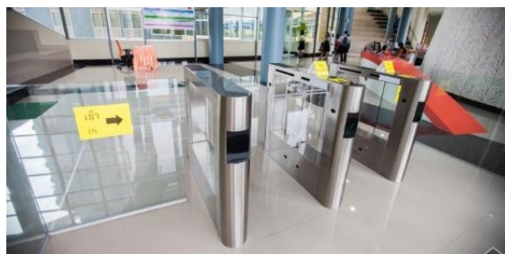
เครื่องสแกนบาร์โค้ดเพื่อเข้าใช้บริการ